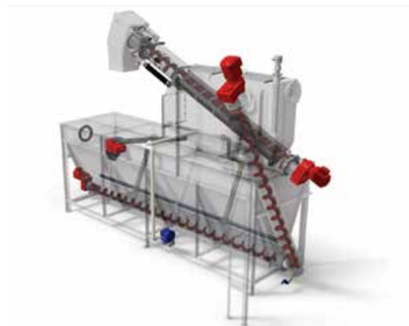
COMBIGUARD® Type 1 inklusive Presskopf

COMBIGUARD® ist eine geeignete Anlage, wenn Sie eine komplette Abwasservorbehandlungsanlage benötigen, die den Anforderungen von kommunalen Kläranlagen erfüllen muss.