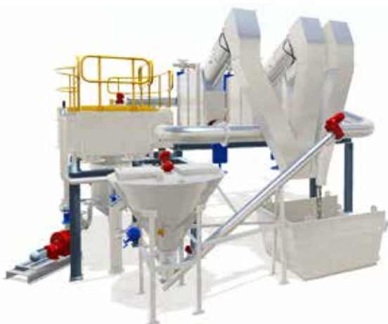
COMBIGUARD® Type2 inklusive SPIROGUARD® Sandfang und SANDWASH™

Type 2: Wir bieten eine große Palette von Produktkombinationen und Rechen, welche die Anpassung des COMBIGUARD® an jede gewünschte Durchflussleistung ermöglichen.